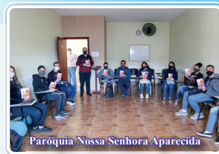
Paróquia Nossa Senhora Aparecida