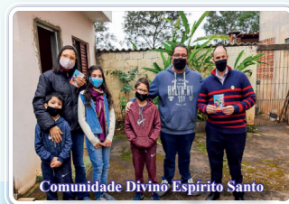
Comunidade Divino Espírito Santo