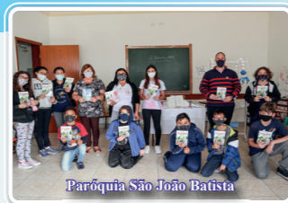
Paróquia São João Batista

Envie as fotos de sua família e grupos de catequese com os nossos livros de apoio à catequese, para serem publicados no Boletim