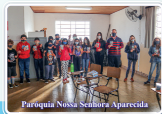
Paróquia Nossa Senhora Aparecida