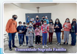
Comunidade Sagrada Família